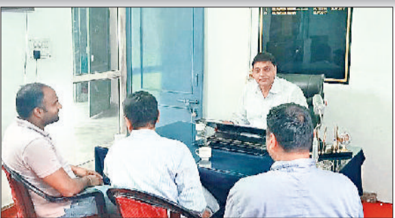
सोनीपत। बैठक के दौरान अधिकारियों को दिशा-निर्देश देते हुए।

फसलों में यूरिया व दवाइयों के अंधाधुंध प्रयोग से जमीन की घटती उर्वरक शक्ति और बिगड़ती सेहत को बनाए रखने के लिए हरियाणा सरकार ने फसलों में जैविक खाद के इस्तेमाल करने की