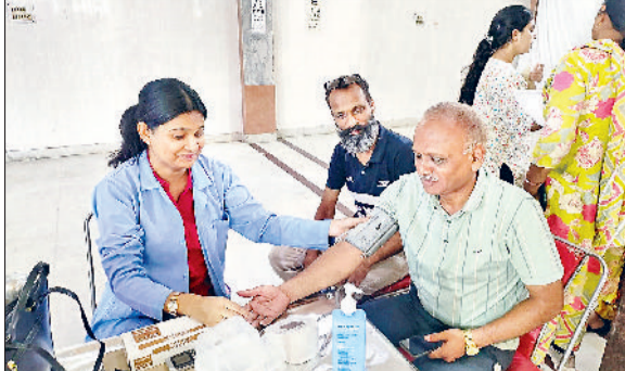
सोनीपत। शिविर में मरीजों की जांच करते हुए चिकित्सक।