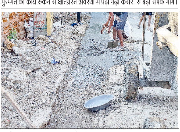
मुरम्मत का कार्य रुकने से क्षतिग्रस्त अवस्था में पड़ा गढ़ी केसरी से बड़ी संपर्क मार्ग। गन्नौर। रोड़े बिछाए बिना सड़क की रिपेयरिंग कार्य करते मजदूर।