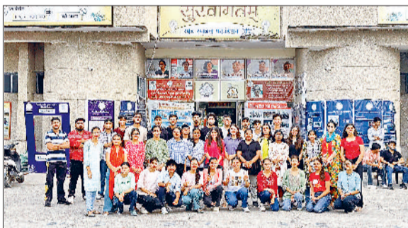
सोनीपत। कार्यक्रम के दौरान उपस्थित फाउंडेशन के पदाधिकारी एवं सदस्यगण।