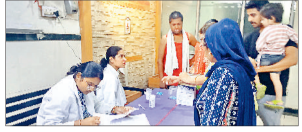
सोनीपत। कैम में जांच करते स्वास्थ्य कर्मी।

जिले में सोमवार से एनीमिया मुक्त भारत कार्यक्रम की शुरुआत हो गई है। यह कार्यक्रम साल में दो बार आयोजित किया जाता है और इसका उद्देश्य जिले में एनीमिया के प्रसार को कम करना और नागरिकों के स्वास्थ्य में सुधार लाना है। जिला नागरिक अस्पताल सहित 23 जगहों पर कैमों का आयोजन किया गया। कैम में करीब 543 गर्भवती महिलाओं की जांच की। जिसमें से 150 महिलाओं का हाई रिस्क गर्भ मिला है। विभाग की तरफ से महिलाओं को रिकार्ड तैयार किया गया है। विभाग की तरफ से महिलाओं के स्वास्थ्य को लेकर