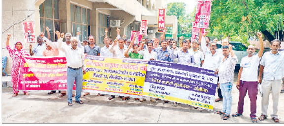
सोनीपत। एचएसवीपी कार्यालय में धरना देने यूनिटन के पदाधिकारी एवं सदस्यगण।

पुराने मार्केट कमेटी रोड पर पेयजल लाइन बिछाने के बाद तोड़ी गई सड़क की रिपेयरिंग कार्य में अनियमितता के आरोप सामने आ रहे हैं। स्थानीय लोगों का कहना है कि सड़क को बिना रोड़े बिछाए ही पक्का किया जा रहा है, जिससे निर्माण की गुणवत्ता पर गंभीर सवाल खड़े हो गए हैं। लोगों ने आरोप लगाया कि निर्माण एजेंसी द्वारा जल्दबाजी में खानापूर्ति करते हुए मिट्टी पर ही सड़क को पक्का करने का प्रयास किया जा रहा है, जिससे कुछ ही समय में सड़क फिर से क्षतिग्रस्त हो सकती है। इससे न केवल सरकारी धन की बर्बादी होगी, बल्कि आम लोगों को भी भारी परेशानी झेलनी पड़ेगी। स्थानीय लोगों ने इस लापरवाही को लेकर नाराजगी जताते हुए संबंधित विभागीय अधिकारियों से जांच की मांग की है। उनका कहना