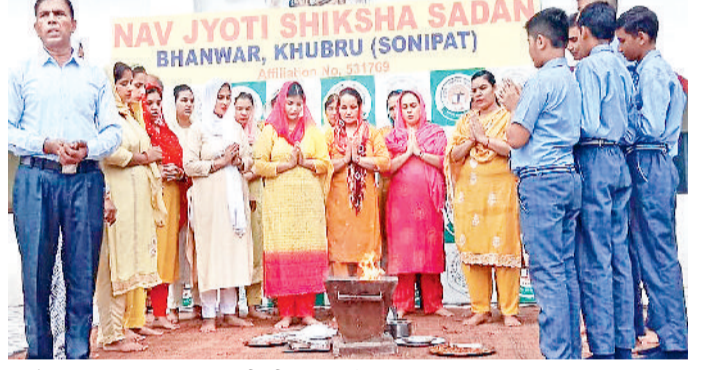
गन्नीर। हवन यज्ञ कर मां सरस्वती की पूजा करते शिक्षक व छात्र।