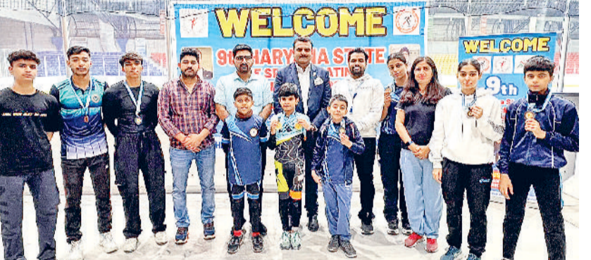
सोनीपत। विजेता खिलाड़ियों के साथ कोच एवं अन्य।